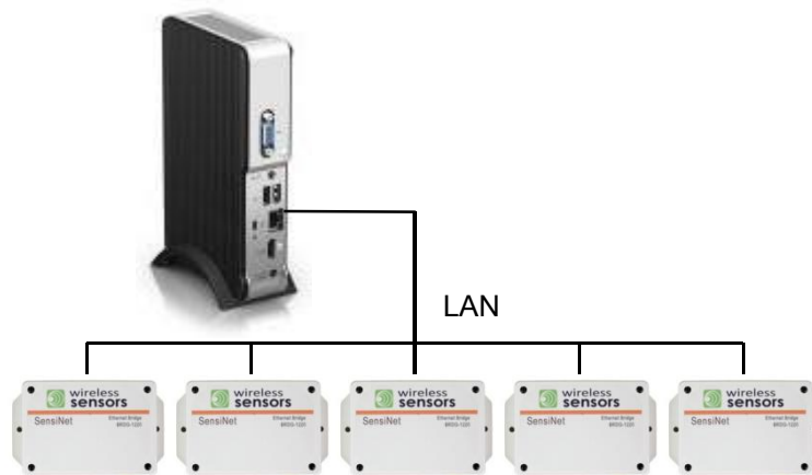
GWAY-2105 e BRDG-1221